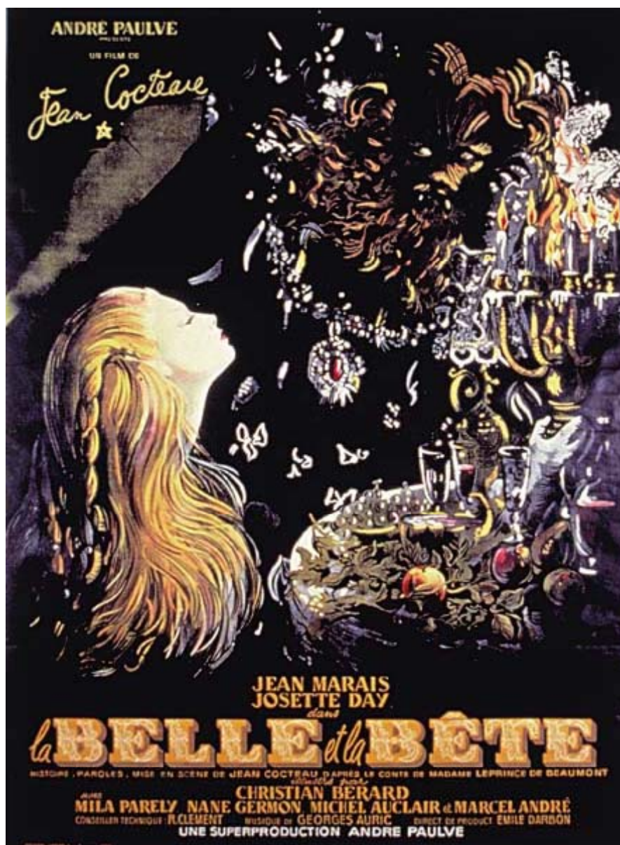
Affiche pour La Belle et la Bête , film de Jean Cocteau

Par Jean-Denis Malclès. Paris, Imprimerie Courbet, 1946 (160 x 120 cm). Pour La Belle et la Bête de Jean Cocteau. France, André Paulvé, 1946 BnF, Arts du spectacle (Aff 53530) © ADAGP Paris 2001